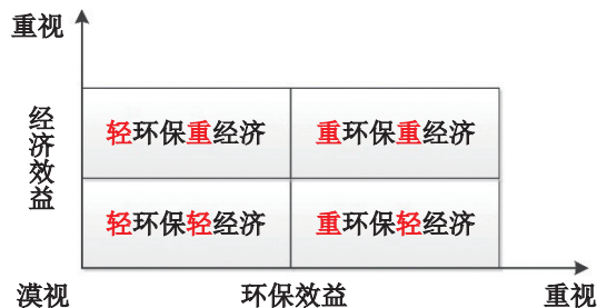
图3 效益矩阵分析图

“碳达峰”压力可能存在另外一种经济含义,即“碳达峰”压力越大,证明该地区碳排放量越多,政府环境治理效果越差,该地区的企业可能更偏向于经济效益而忽略环境效益,从而使盈余持续性表现更好。为此,我们构建基础分析矩阵,按照“环保效益”和“经济效益”两个维度划分为四个象限,如图3所示,每一个象限都代表了不同地区的政府效益倾向。